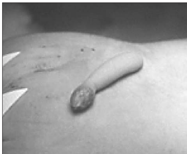
Figure 2. Appendice caudal.

Les entretiens obtenus avec les familles ont révélé des particularités dont aucune ne peut expliquer le cluster : une grossesse a été obtenue après fécondation in vitro , une mère est épileptique et elle a reçu pendant toute sa grossesse un traitement comprenant Dépakine®, Zaronin® et Urbanyl® ; 14 mères sur 35 ont fumé en début de grossesse, l'une a consommé de la